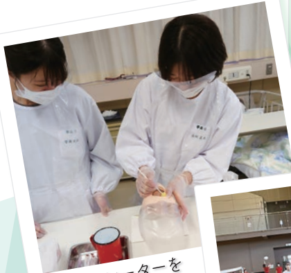
シミュレーターを 使った 看護技術演習