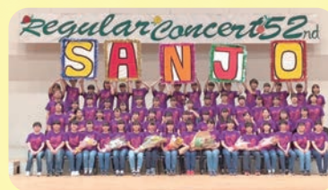
高校時代の思い出

先生方のサポートはとても手厚く、悩みがあればすぐに相談できる環境です。また、同じ夢を目指す仲間と支え助け合い、一緒に頑張れる環境にいられることがとても幸せです。