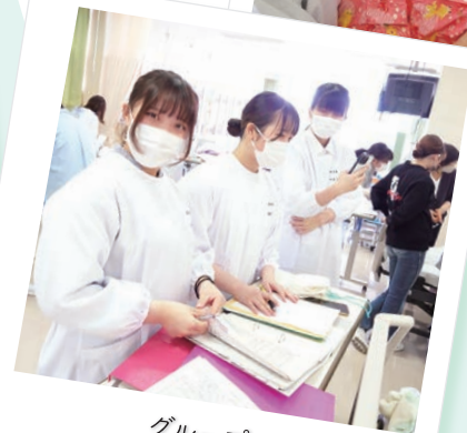
グループで 看護技術演習