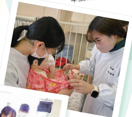
小児看護 シミュレーション