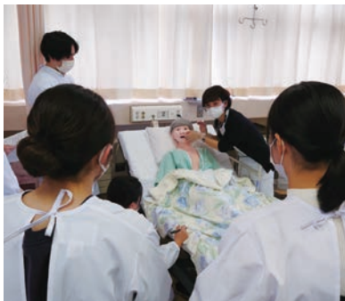
経管栄養のデモンストレーション